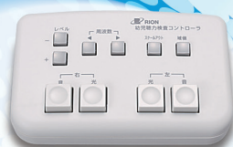
コントローラ (別売)