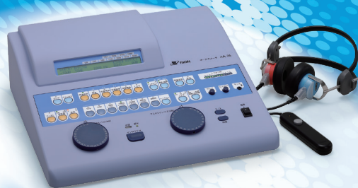
オーディオメータAA-76 (別売) 医療機器認証番号 20900BZZ00546000